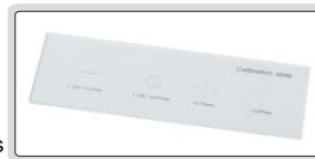
placa de calibração de vidro (inclusa)